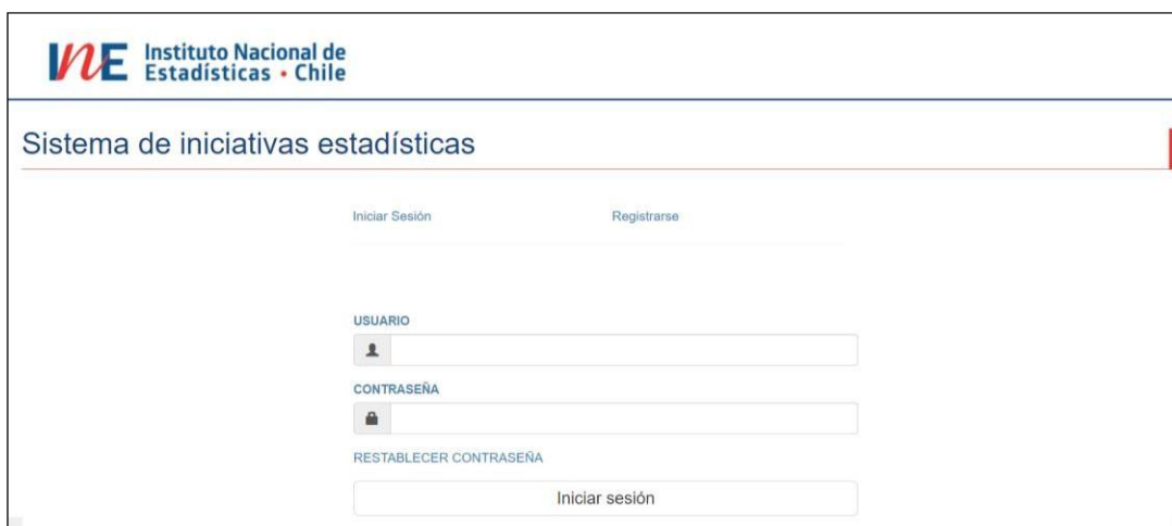
Figura 1: Visualización estándar de la pantalla de ingreso el Sistema de Iniciativas Estadísticas.

Nota: se sugiere refrescar el navegador y limpiar el historial de visitas antes de ingresar al sistema, esto asegura el mejor funcionamiento de la plataforma.