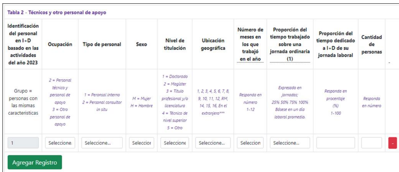
Ilustración 5. Tabla de técnicos y personal de apoyo y otro personal de apoyo